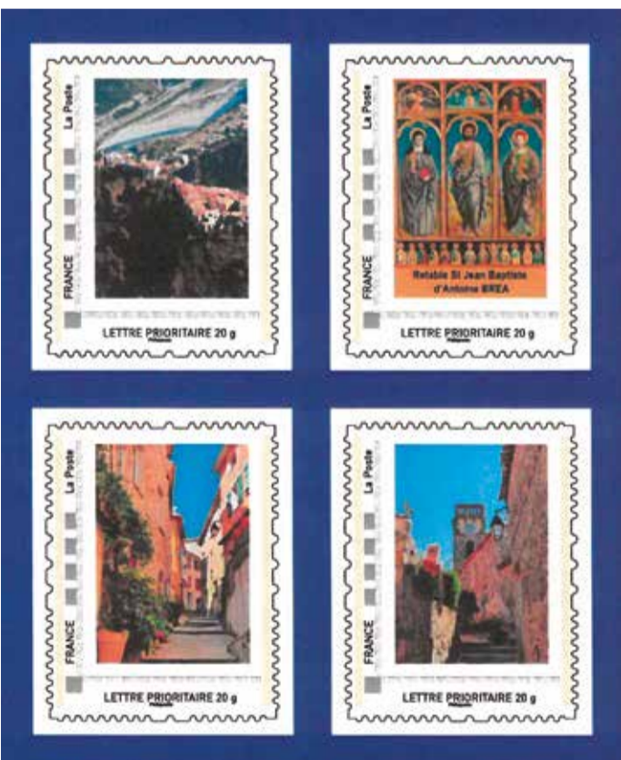
Graphisme de la couverture : Norma Rosso Conception du carnet de timbres : Cédric Lebouteiller et Florence Carello

Une magnifique carte de vœux a été envoyée aux habitants avec 4 timbres représentant des vues du village et du retable de Bréa. Une attention très appréciée, et qui donnera certainement envie aux destinataires auxquels vous les expédiez de venir découvrir notre commune.